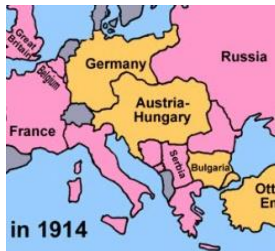
מרכז אירופה בימי הממלכה האוסטרו-הונגרית

בסוף המאה שעברה ותחילת המאה הזאת ידעה אירופה תקופה נאורה של רגיעה ממושכת, מלווה בקדמה פוליטית, תרבותית וטכנולוגית אדירה. הלכו והתרבו ניסיונות מוצלחים של שיתוף פעולה בינלאומי פורה בתחומים רבים כגון: יסוד איגוד הדואר העולמי (1875), חידוש עריכת המשחקים האולימפיים (1986), בית המשפט