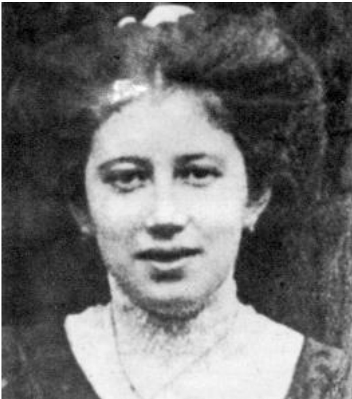
אמא (1910 בת 19)