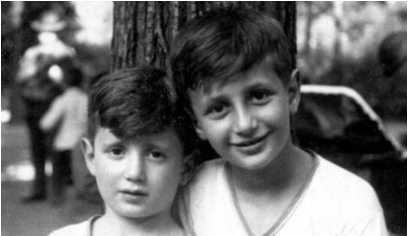
אנחנו ב 1930