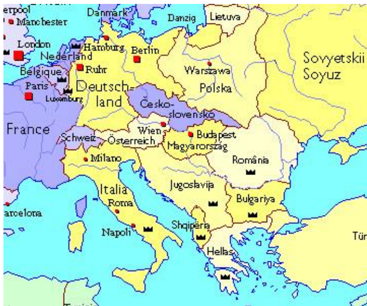
מרכז אירופה 1937

אוסטרו-הונגריה או כפי שכונתה בפי היסטוריונים "הממלכה הכפולה", הייתה יצור שעטנז יחיד במינה במרכז אירופה. מדינה זו שהתקיימה כ-50 שנה (1867-1918) ושנשלטה ע"י הקיסר (של אוסטריה) והמלך (של הונגריה) פרנץ-יוזף, דמות פטריארכלית שהאריך לא רק ימים (בן 86 במותו) אלא גם שנות מלכות (68 שנה), בוססה לכאורה על שלילה מוחלטת של גזענות. ההנחה הייתה ש-8.5 מיליון צ'כים, 5 מיליון פולנים, 4 מיליון רוסינים, 7 מיליון יוגוסלבים ו-3,3 מיליון רומנים יכולים להיות נשלטים במחצית האחת של האימפריה ע"י 12 מיליון גרמנים ואילו במחצית השנייה ע"י 10 מיליון הונגרים. ברם, למרות המזרות שבדבר חשבו אז רבים וטובים, אפילו מבין המיעוטים המדוכאים, שחבילה משונה זו מתפקדת ומשרתת את שותפיה מכורח המציאות, והתפרדותה תטיל אנדרלמוסיה ושואה על לבה של אירופה.